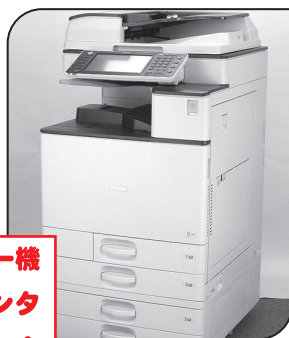
コピー機 レーザープリンタ スキャナ

白黒・単色/1枚10円 カラー A4以下/1枚50円 カラー B4以上/1枚80円